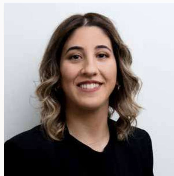
Co-founder di aura

Responsabile di chirurgia orale e implantologia dentale, odontoiatria pediatrica e restaurativa.