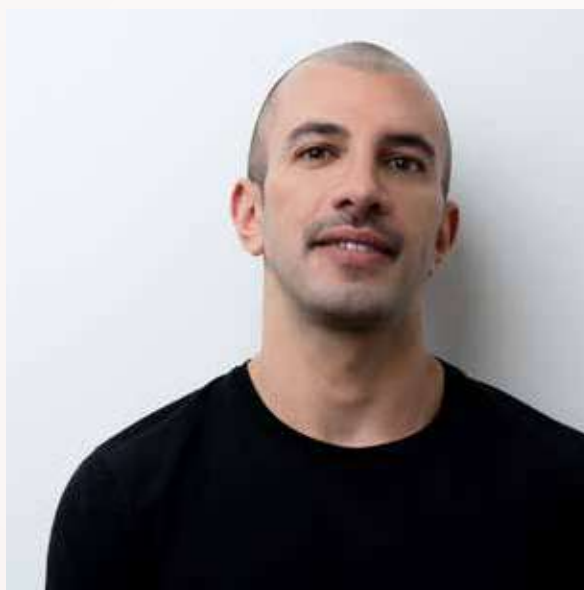
Dir. San. e co-founder di aura

Responsabile di Ortodonzia fissa e invisibile e Medicina Estetica Odontoiatrica dei denti e viso.